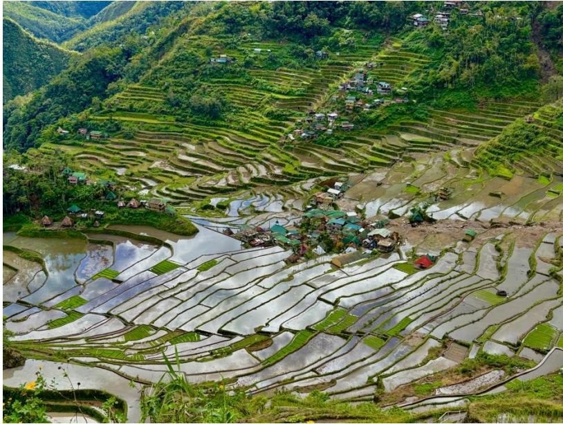
Les rizières en terrasses de Batad, classées au Patrimoine mondial de l'Unesco.