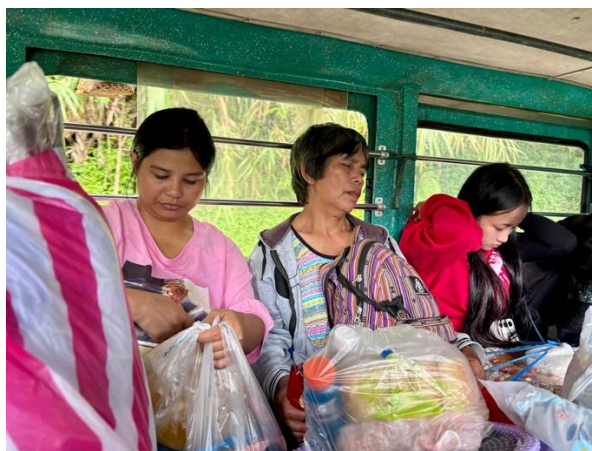
Excursion en jeepney

leurs coutumes ancestrales. Dîner au village. Retour en jeepney à Banaue. Visite du musée de la Sculpture de la Cordillère qui présente une belle collection d'armes et d'objets anciens du peuple Ifugao. Souper à l'hôtel, suivi du spectacle de danses traditionnelles Ifugao. Nuit à Banaue : Banaue Grandview (ou similaire).