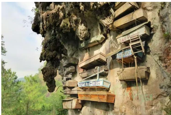
les cercueils suspendus

objets traditionnels présentant le mode de vie et les coutumes des diverses tribus montagnardes de la région. Dîner dans un restaurant local. Poursuite de la route vers Banaue. Passage par le col du mont Pulis et arrêt à un point de vue surplombant les spectaculaires rizières en terrasses de Banaue . Installation à l'hôtel. Souper et nuit à Banaue : Banaue Grandview (ou similaire).