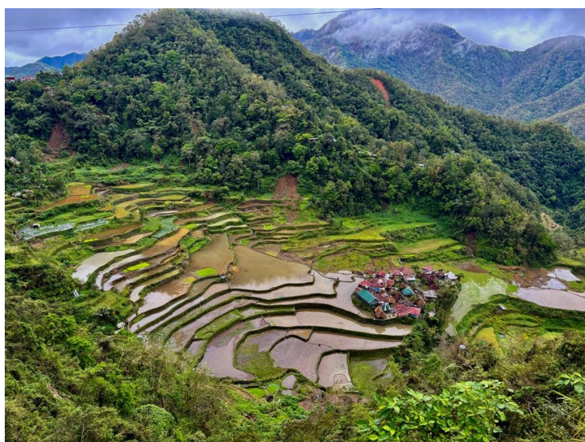
Les rizières en terrasses de Bangaan.