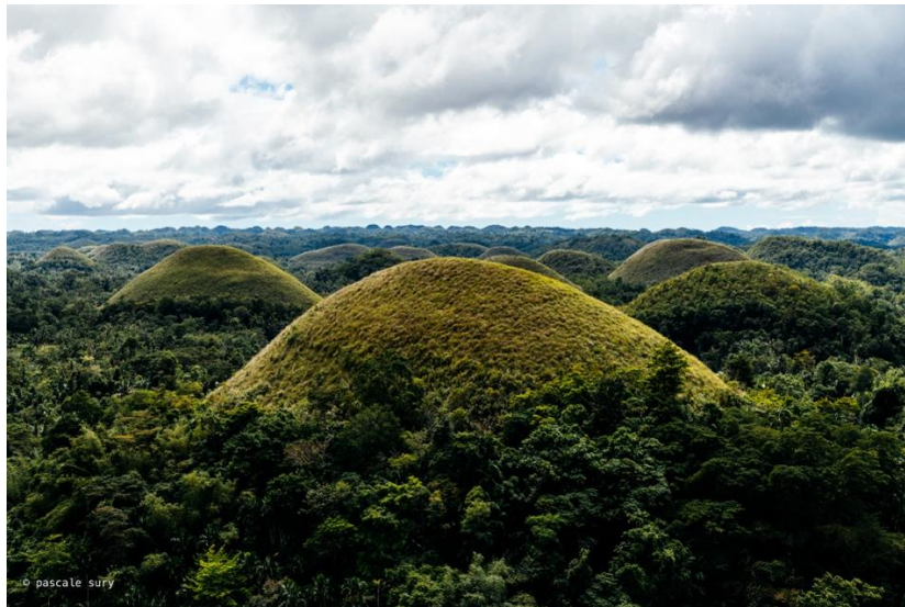
Les Chocolate hills