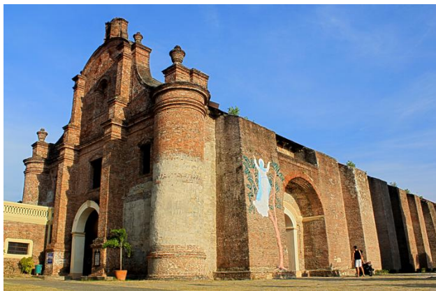
Santa Maria: église de Nuestra Senora de l'Asuncion

route transversale via Cervantes, bifurquant ensuite par la célèbre route de montagne Halsema, la plus élevée des Philippines. Arrêt à Santa Maria pour la visite de l' église de Nuestra Senora de l'Asuncion . Cette robuste construction de 1769, dans un style « baroque des tremblements de terre », figure au Patrimoine mondial de l'UNESCO pour son caractère unique. Poursuite de la route vers Sagada, nichée dans les montagnes. Installation à l'hôtel en fin d'après-midi. Souper et nuit à Sagada : Saint Joseph Resthouse ou Lalouette Inn ou Mount Data.