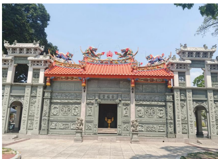
Quartier de Santa Cruz: cimetière chinois