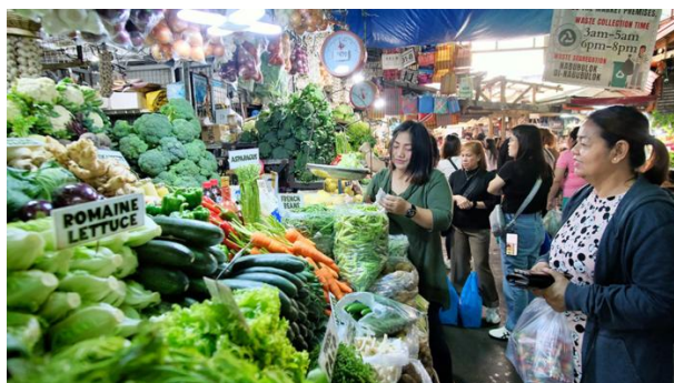
Marché de Baguio

par un lahar à la suite de l'éruption du volcan Pinatubo en 1991. Fondée au XVIIe siècle, c'est l'une des plus anciennes églises de l'archipel. Arrivée et installation à l'hôtel en fin d'après-midi. Souper à l'hôtel. Nuit à Manille : The Manila Hotel ou Lanson Place.